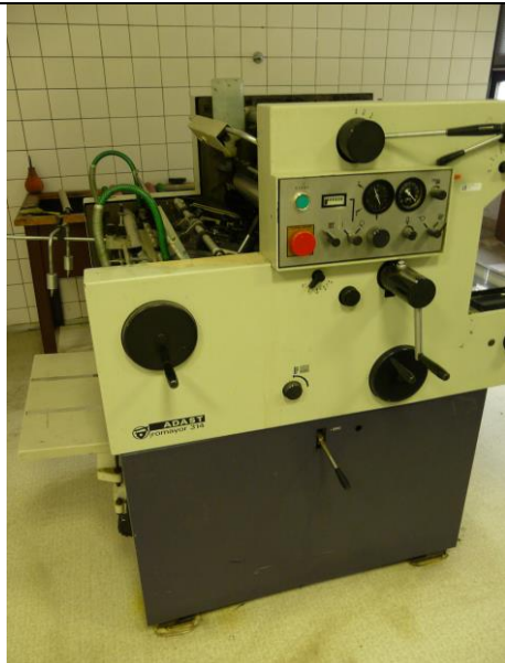
Poškodená hydraulika, valce