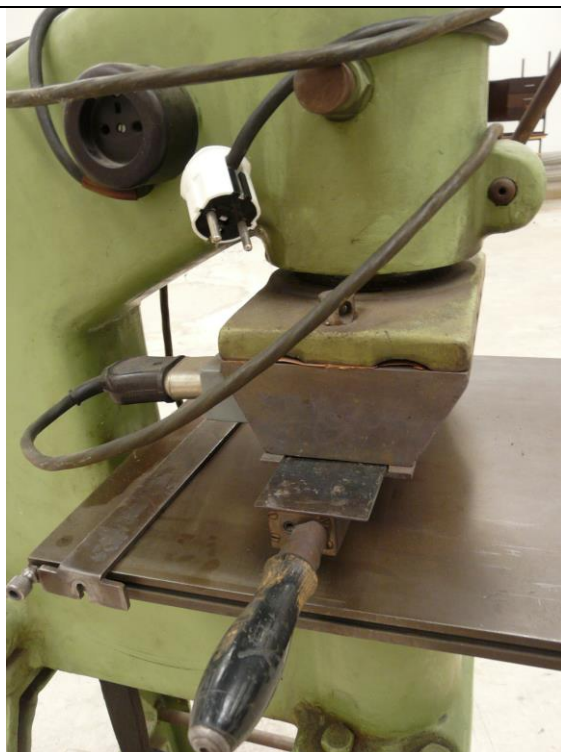
Tabuľové nožnice na lepenku, inv.č. z49266/0001 Výrobok fabriky Kovopodnik Pardubice, typ 50/125

II.1 Zariadenie nepoškodené, nerekonštruované, nemodernizované. Obstarané bolo v roku 1963 II.2 Zariadenie kompletne II.3 Techn.stav zariadenia bez revízií, stará elektrická inštalácia II.4 Bez mimoriadnej výbavy II.5 Opatrebovaný k_{mo}=0,7 ; stroj zastaralý, vysoký odber elektriky k_{pt}=0,6 ; dokumentácia nedostupná k_{ps}=0,6 ; náhradné diely ťažko dostupné k_{pd}=0,2 ; dopyt v miere potreby k_{pi}=1,0 ; samostatný stroj.zariadenie k_{pi}=0,7 ; bez revízie elektrorozvodov