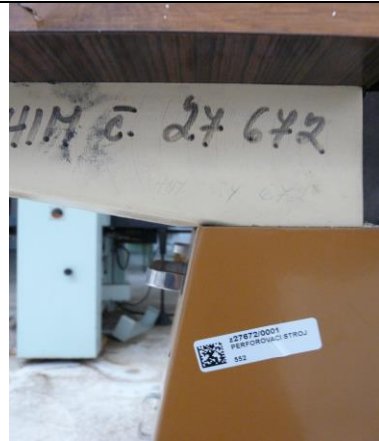
Perforovací stroj PD70/75; inv.č.z27672/0001

II.1 Zariadenie nepoškodené, nerekonštruované, nemodernizované. Obstarané bolo v roku 1986 II.2 Zariadenie kompletne II.3 Techn.stav zariadenia bez revízií II.4 Bez mimoriadnej výbavy II.5 Opatrebovaný k_{mo}=0,5 ; stroj zastaralý, vysoký odber elektriky k_{pt}=0,6 ; dokumentácia nedostupná k_{ps}=0,5 ; náhradné diely ťažko dostupné k_{pd}=0,2 ; dopyt v miere potreby k_{pi}=1 ; samostatný stroj.zariadenie k_{pi}=0,6 ; bez revízie elektrorozvodov